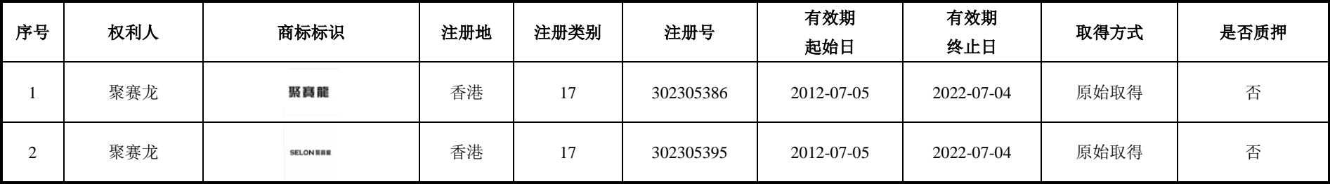
附表二 境外商标权