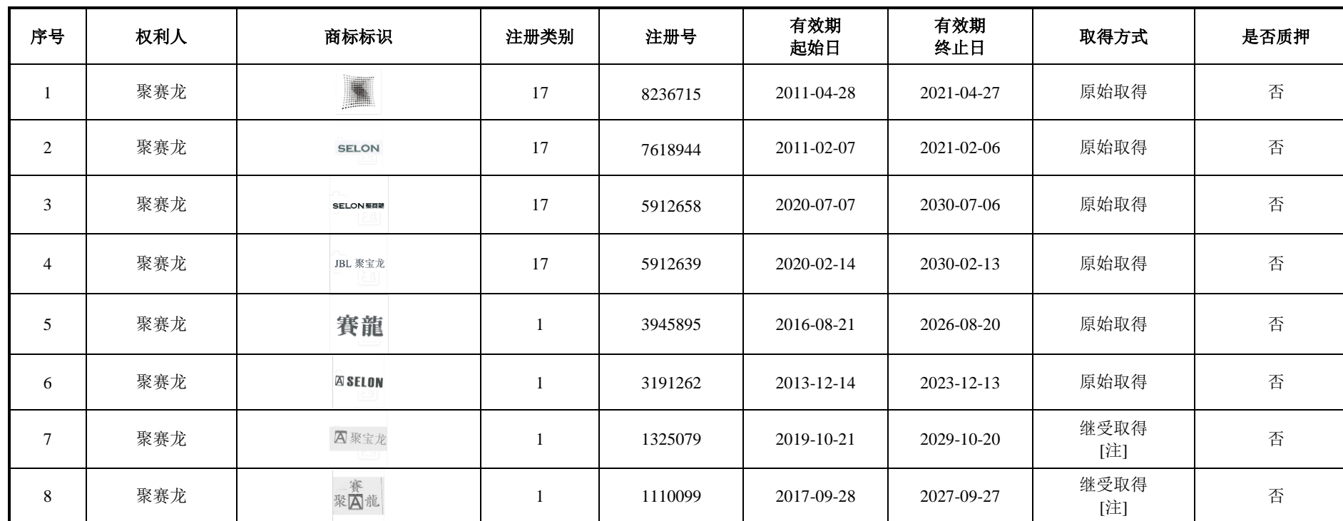
附表一 境内商标权